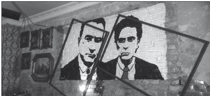
AUCH Paten mögen Tramezzini.

BER Bar, Pannierstr. 56, Mi-Sa 19:00-3:00, Facebook: BER.Neukoelln 49 bruch Bar, Pannierstr. 57, tgl. 8:30-1:00, Facebook: Bruch 50