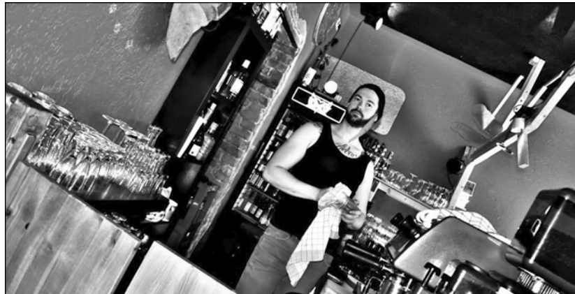
DER Chef poliert persönlich.

Wer also gerne mal woanders ist, ohne weit weg zu müssen, sollte in der Bar vorbeischauchen. Einen Besuch ist sie auf jeden Fall wert. cr