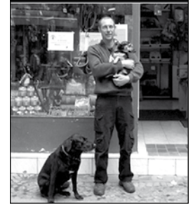
WALDIS Wohl.

Außerdem gibt es bei Doddeck bestes Wild zu einem guten Preis, aber natürlich alles »nur für den Hund«. Bei all den Horrorgeschichten, die