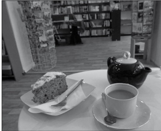
DA wird Lesen zum Genuss.