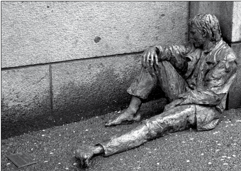
FRÜHLING macht schlapp, gebt mir einen Brennesseltee!

Einen Teelöffel der Mischung mit 200 ml kochendem Wasser über-