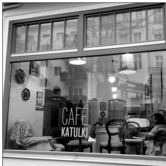
WOHNZIMMER auf polnisch-italienisch.

Deutsch als Fremdsprache ebenso wie für Jiddisch. Workshops zum Stricken und Nähen wecken wiederum die Lust am Handarbeiten. Ein kreatives, kulturelles Kreuzköllner Kleinod.