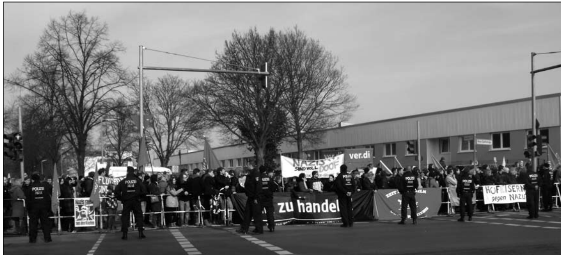
BÜRGER schützen das Asylantenheim vor Neonazi-Demonstranten.