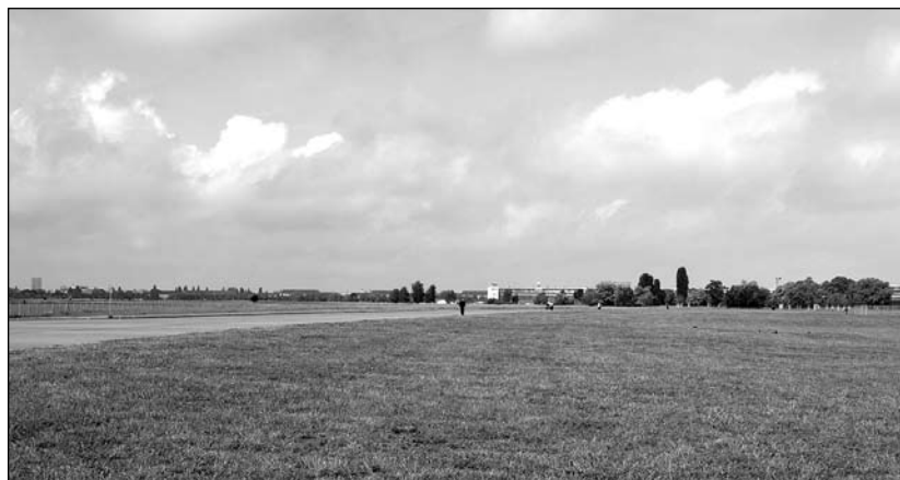
WEITE - noch ist sie unverbaut.

Einig waren sich allerdings alle in der Einschätzung, dass es dem Einsatz der Bürgerinitiative zu verdanken sei, dass jetzt stadtwweit über das Feld diskutiert werde. Viel wäre schon gewonnen, wenn noch einmal völlig neu geplant würde, dann aber auch mit echter Bürgerbeteiligung. mr