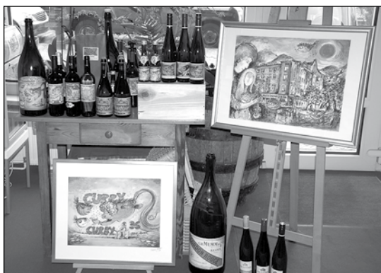
VON der Leinwand auf die Flasche.

GmbH« gesammelt. Eine Auswahl daraus zeigt sie in dem Geschäft als ständige Ausstellung. »Guter Wein im Top Design« ist die Idee, die sich entwickelt hatte, und