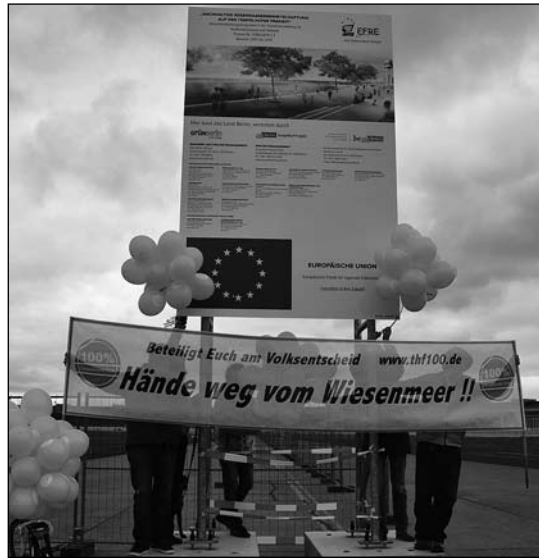
NOCH kein Badetümpel für Ente & Co.

besondere Landform des Geschäftsführer des und Rundweg zu gra- »BUND Berlin e.V.«: