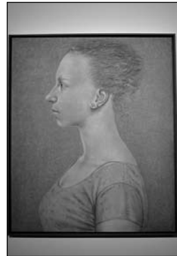
»AUF Falten habe ich keine Lust.«

Straße. Sie lädt sie in ihr Atelier ein und hofft, dass sie dann auch kom-