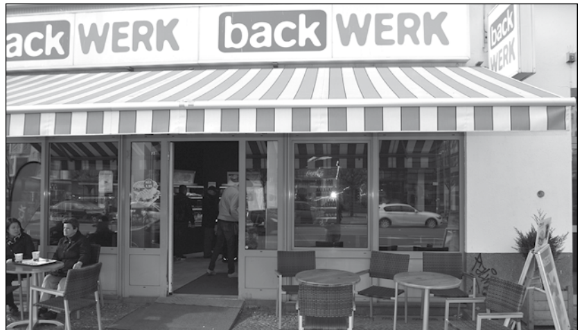
EIN wichtiger Fensterplatz im Backshop.

kommt fast jeden Tag und will immer nur auf dem einen Platz sitzen.« Tatsächlich war der Platz, auf den sich die Dame unbedingt setzen wollte, ein paar Minuten später frei. Aber die Dame war nun mal weg. Auch ich musste schmunzeln, irgendwie